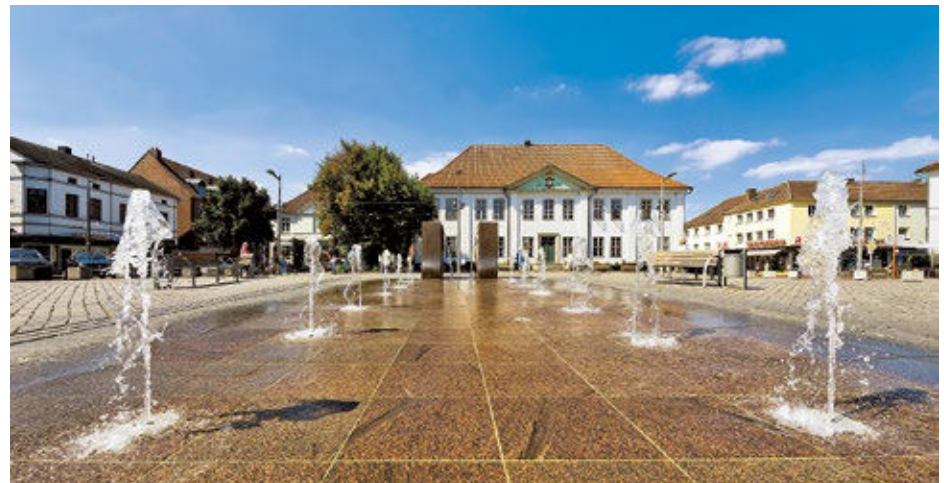
Mittendrin: Der Marktplatz ist eine beliebte Station bei einem Stadtrundgang durch Ratzeburg. Hier residiert das geschichtsträchtige Alte Kreishaus. Im Sommer erfrischen die Wasserspiele auf dem polierten Pflaster.