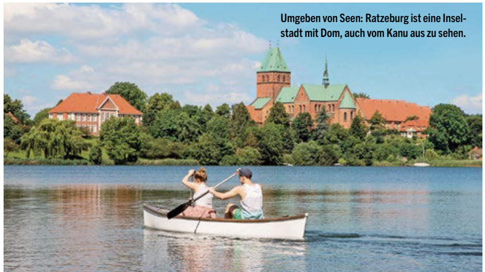
Umgeben von Seen: Ratzeburg ist eine Inselstadt mit Dom, auch vom Kanu aus zu sehen.

Wiederum um die Ecke steht das Paul-Weber-Museum, ein Gebäude aus dem 17. Jahrhundert. Tipp: An der Eibe, einem Naturdenkmal an der Nordseite des Museums, fanden A. Paul Weber und seine