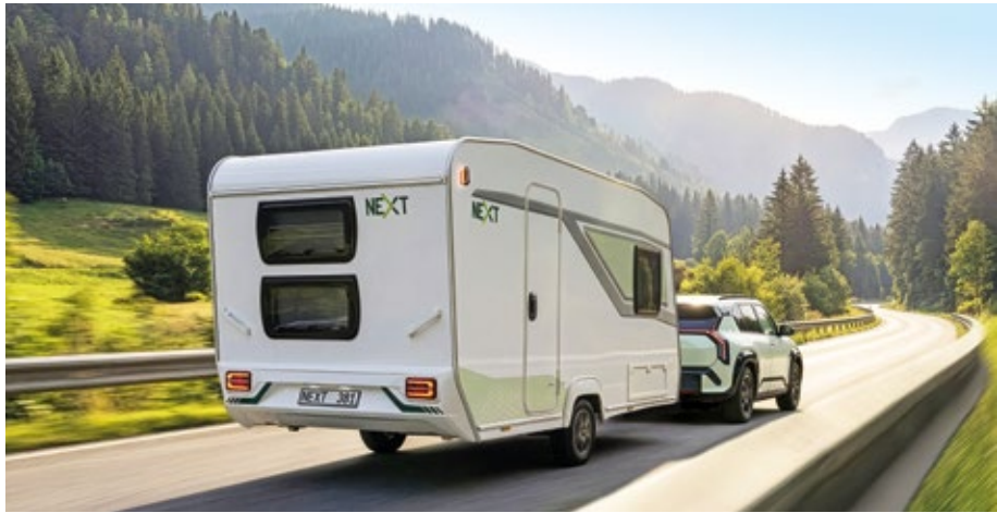
Fast alle Caravan-Hersteller machen sich Gedanken über die Zukunft, was Preis, Gewicht und Form des Caravans der Zukunft bedeuten. Manche gründen hierzu Zweitmarken, wie es Fendt mit Next gerade macht.

Leichtbau darf aber nicht Verzicht bedeuten. Innenräume müssen wohnlich bleiben – etwa mit textilen Oberflächen, modularen Möbeln und multifunktionalen Lösungen. Entscheidend ist, dass jedes Bauteil mehrere Aufgaben erfüllt: sitzen, schlafen, verstauen, dämmen oder Energie sparen. ▶