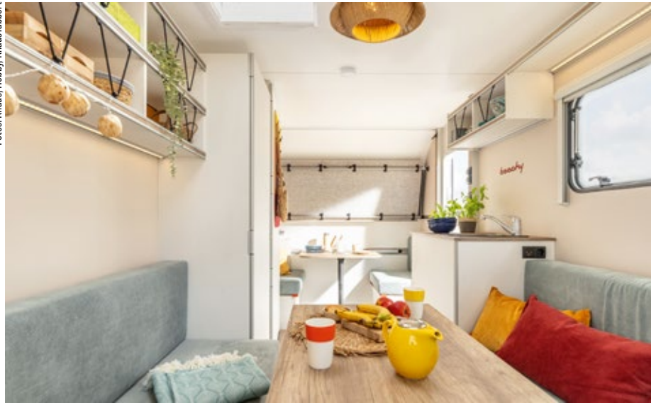
Leicht muss nicht immer Verzicht bedeuten, aber weniger bedeutet einfach oft mehr Einsparung. Das kann aber durchaus ergonomisch und alltagstauglich gestaltet sein, wie es Hobby mit seinem Beachy unter Beweis stellt.

gilt es einiges zu bedenken, da das zulässige Zuggesamtwicht von 3,5 Tonnen für den B-Führerschein mit einem schweren E-Auto schnell erreicht ist. Einige Caravanhersteller haben dies bei der Entwicklung neuer Baureihen bereits berücksichtigt.