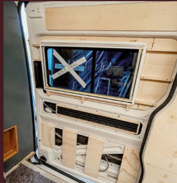
Der Fußboden: 11 mm dicke Multiplexleisten wurden auf die Karosserie geklebt und zum Trocknen fixiert, der Boden mit 9 mm Armaflex isoliert, die alte Bodenplatte wieder eingebaut und Vinylböden darauf verlegt. Unten: Die Verkleidung der Schiebetür wird aus 4 mm starkem Birke-Multiplex gefertigt und anschließend mit Filz bezogen. Im unteren Teil der Schiebetür wurde auf Isolierung verzichtet, damit Kondenswasser abtropfen kann.