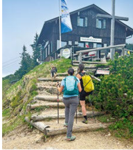
Schönes Ziel: Das Tegelberghaus ist die einstige Jagdhütte der Wittelsbacher Könige. Wenn es dem Vierbeiner zu lange wird, muss der Zweibeiner helfen.