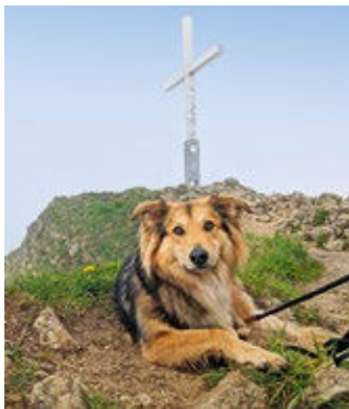
Weiter Weg: Bis hinauf zum Gipfelkreuz dauert es mehrere Stunden. Hunde (und Menschen) schaffen die Strecke mit Pausen.