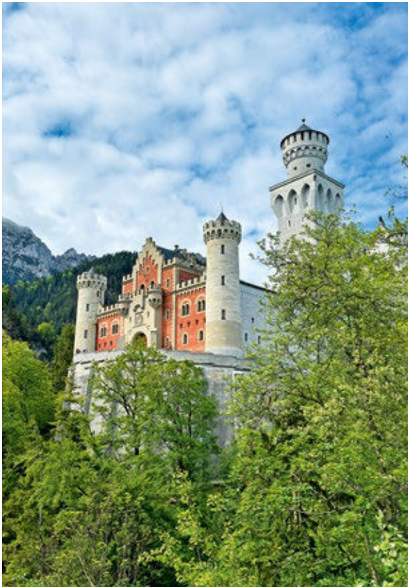
Weiter Blick: Dem Tegelberg liegt das Voralpenland zu Füßen. Der Weg zum Gipfel führt vorbei an Schloss Neuschwanstein.