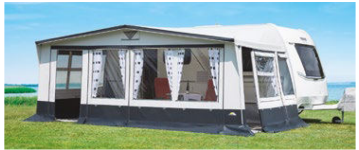
Mit dem Ambassador III 300 hat dwt-Zelte seinen erfolgreichen Klassiker im Segment der Luxus-Vorzelte für Saison- und Ganzjahrescamping weiter optimiert.