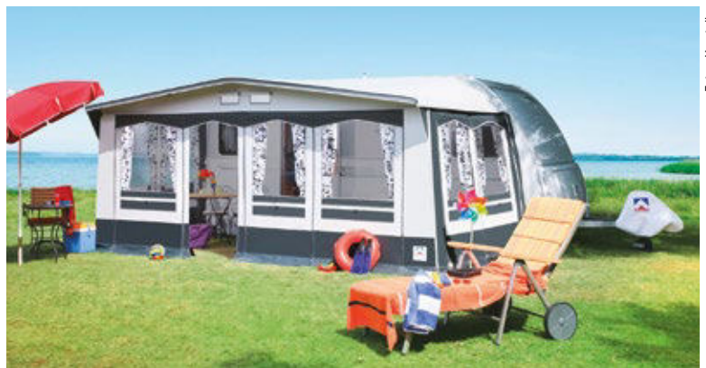
Die GÜSTO-Zeltmanufaktur will 2024 noch mehr Flagge zeigen. Die Niedersachsen stehen für maßgeschneiderte Individualzelte zum guten Preis, wie zum Beispiel das CaraVilla Pro Erker. Durch die Konfiguratorlösung sind aber bis zu zwölf Farbvarianten und Ausstattungen möglich.

www.guesto.de/wohnmwanzelt/caravilla-ganzzelt