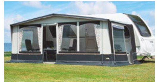
Das Jubilee 40 gibt es nun auch in 240 cm Tiefe und soll so ideal als Zelterstkauf für Campingeinsteigern geeignet sein.