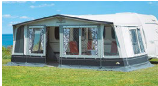
Als Neuheit bietet dwt 2024 das Wohnwagen-Vorzelt Domino 250 mit einer hellen Farbästhetik in lichten Graunuanzen an.