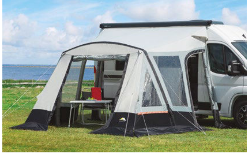
Das neue dwt Fortuna Air ist leicht handhabbar, gut transportabel und geräumig. Es ist zwar für Kastenwagen konzipiert aber ebenso an jedem Caravan einsetzbar.